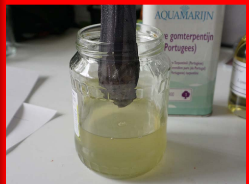
Je kunt vernis zelf maken door dammarharsbrokjes in een nylonkous gedurende drie dagen in een oplosmiddel zoals gomterpentijn of zest-it te hangen. Het is echt niet moeilijk.