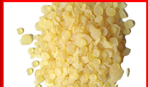
Dammarhars (b.v. Vermolen De Kat)